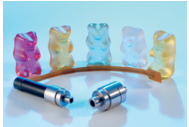
Größenvergleich Micro Harmonic Drive® Getriebebox (rechts) und Hohlwellenservoantrieb (links) mit Gummibärchen.

Mikroantriebssysteme, bestehend aus Getriebebox und Mikro-Schrittmotor, werden in Serienanwendungen in Bereichen wie Medizintechnik, Halbleiterfertigung und Photonik eingesetzt.