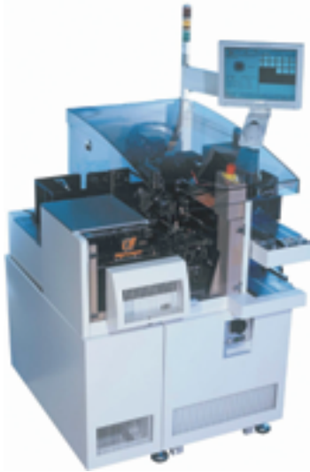
Easyline Die Bonder Maschine. Rechts: Die Rotary Bond Tool Baugruppe.

Folge ist, dass der Motor fast keine Lasttr agheit merkt. In Kombination mit dem geringen Eigentr agheitsmoment des Getriebes f uhrt dies dazu,